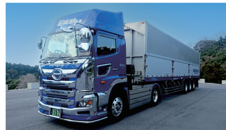
バンセミトレーラー