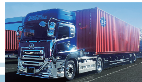
トラクターヘッド