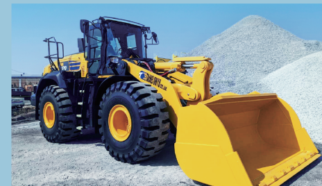
ホイールローダー