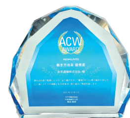
働き方改革優秀賞受賞 (コクヨ株式会社様より)