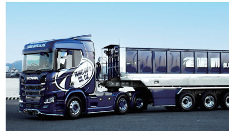
ダンプセミトレーラー

車両紹介 | さまざまな重量に対応可能な車種を豊富に取り揃えております。どんなお荷物でも安心してお任せください。