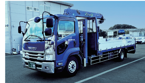
クレーン付トラック